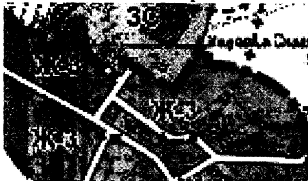
Утвержденные правила землепользования и застройки